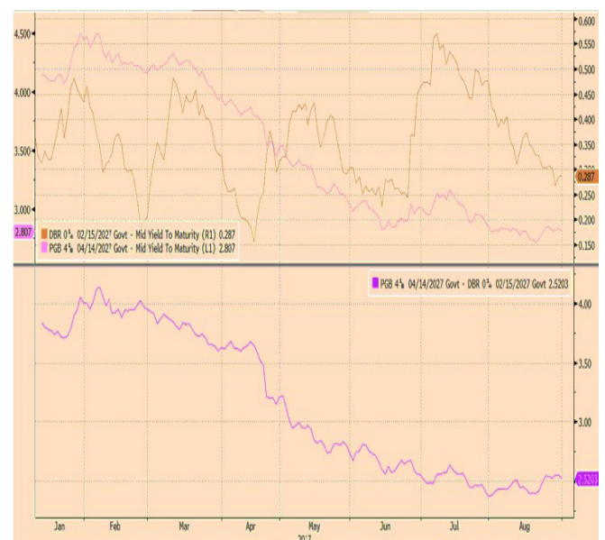
Spread OT27 vs Bund27 (252pts)

Destaque ainda para as tensões geopolíticas entre os USA e a Coreia do Norte, na sequência de novos testes balísticos e nucleares que acabaram por originar ameaças de parte a parte e um significativo aumento da volatilidade nos principais mercados Asiáticos.