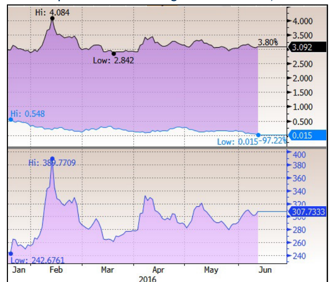
Divida Pública Portuguesa 2026, Bund 2026 & spread

Os bons dados da economia Alemã e a maior probabilidade de manutenção do UK dentro da União Europeia, acabaram também por favorecer e potenciar os ganhos dos índices (apesar do Footsie ter sido dos poucos a acabar negativo com -0.2%).