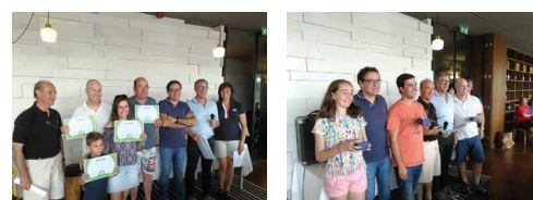
Alguns dos participantes na Clínica de Golfe SNQTB/Ótica SAMS Quadros a receber os seus diplomas.