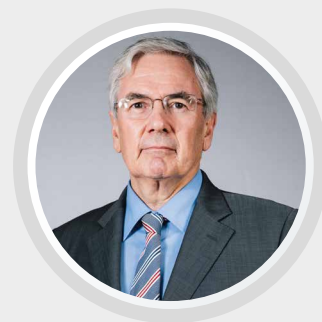
LUÍS CARDOSO BOTELHO Diretor Nacional SNQTB

“A vitória deveu-se ao esforço de divulgação e de envolvimento na campanha. Vamos agora desempenhar as funções na Comissão de Acompanhamento com o mesmo grau de compromisso e de empenho”.