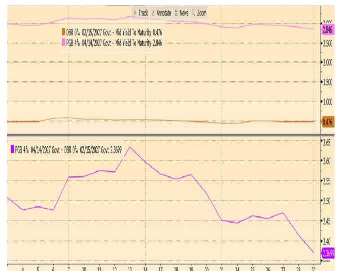
Spread OT27 vs Bund27 (236pts)

Em Portugal os índices de confiança de empresários e consumidores confirmaram o bom momento da economia, destacando-se a aceleração das vendas a retalho no mês.